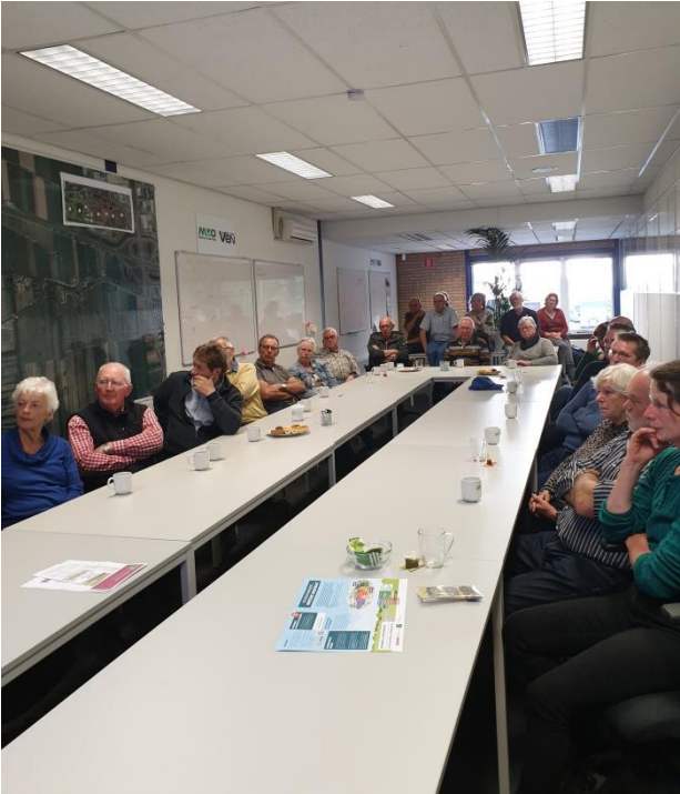
Enkele foto's van de excursie op 3 mei 2022