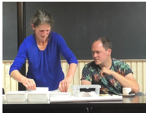
Fons en Ria tijdens de jaarvergadering van oktober 2021

In 2015 ben ik gevraagd of ik misschien in het bestuur van de Agrarisch Natuur en Landschapsbeheer (ANLB) West Brabant wilde plaatsnemen... Na wat wikken en wegen, ben ik maar een keer gaan meedraaien. Dat beviel wel, we hebben veel ANLB regelingen weg kunnen zetten in West Brabant. Na dat ruim een jaar gedaan te hebben, bleek het toch wel handig dat ik wat vaker bij de bestuursvergaderingen van de ANV aansloot. Er was namelijk nogal wat afstemming nodig, en zo is het balletje gaan rollen.