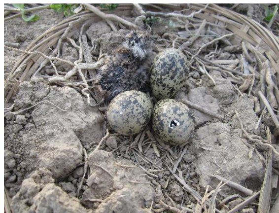
Foto: Kievietsnest met drie eieren, eentje waarbij het kuikentje bijna uitkomt, en een kievietskuiken al uit het ei. Eerder alles in een mandje gelegd om indien nodig te kunnen verplaatsen.

Zij beschermen de nesten door ze, soms op afstand, soms van dichtbij, te lokaliseren en ze te trachten te beschermen tegen beschadiging door veldwerkzaamheden door boer en loonwerker. Dit kan gebeuren door, soms te waarschuwen met stokjes te plaatsen, maar vaak is het ook nodig om de nesten, tijdelijk, te verplaatsen en later terug te zetten.